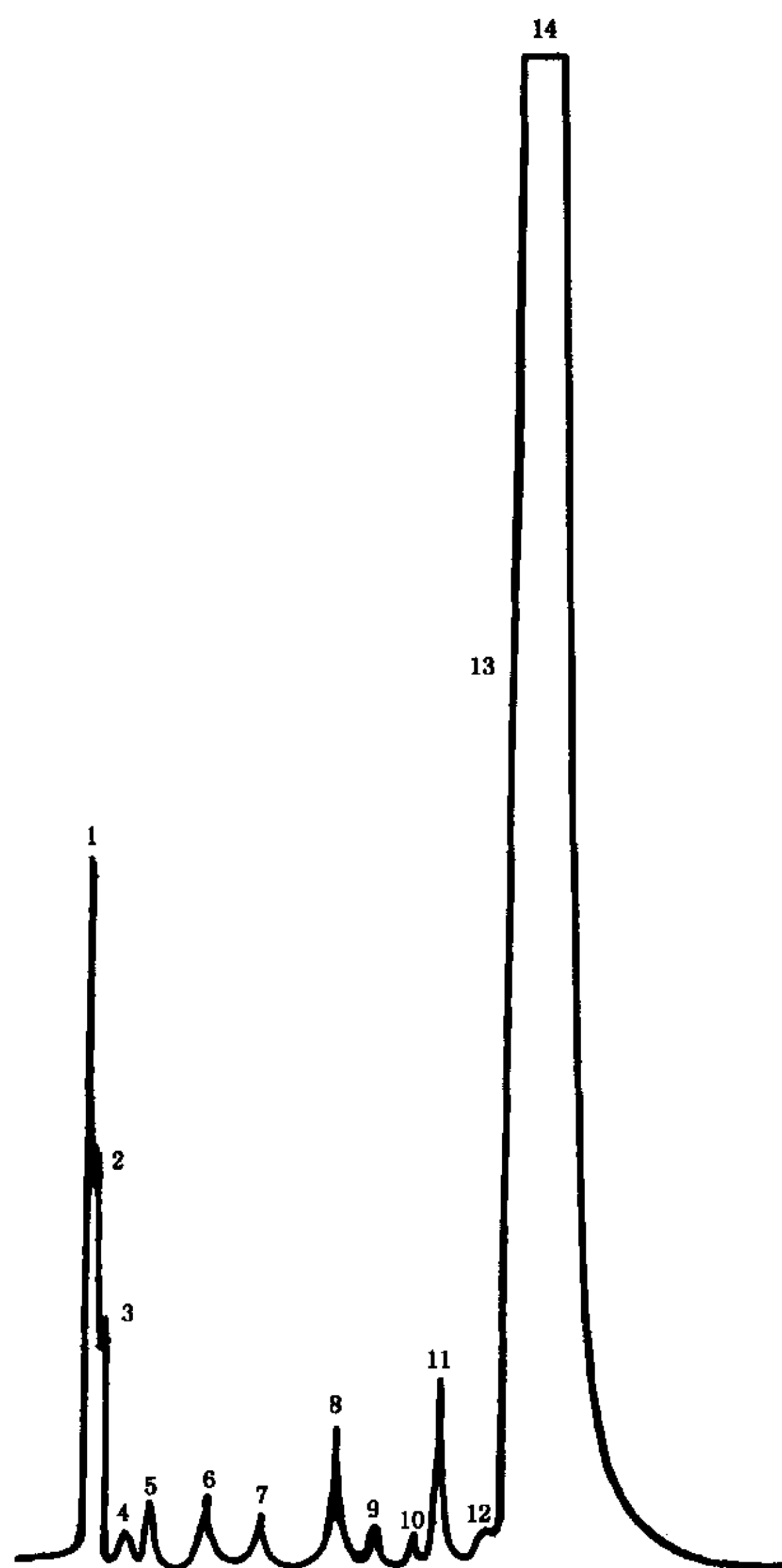
1—2-乙基己醇;2—丁酸辛酸;3—未知峰;4—二辛基酯;5—苯酐;6—苯甲酸辛酯;7—未知峰; 8—邻苯二甲酸二丁酯;9—未知峰;10—未知峰;11—邻苯二甲酸丁辛酯;12—未知峰; 13—邻苯二甲酸二异辛酯;14—邻苯二甲酸二辛酯